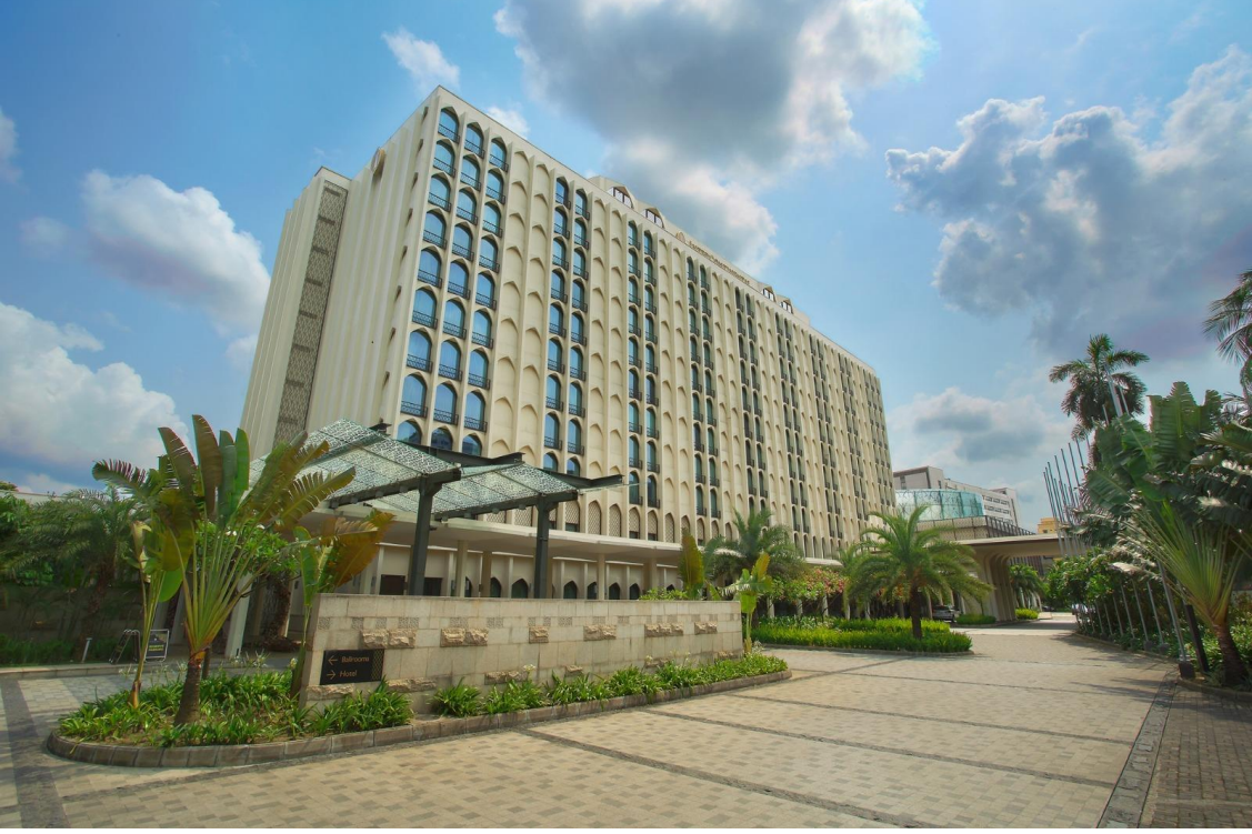
ছবি: ইন্টারকন্টিনেন্টাল ঢাকা