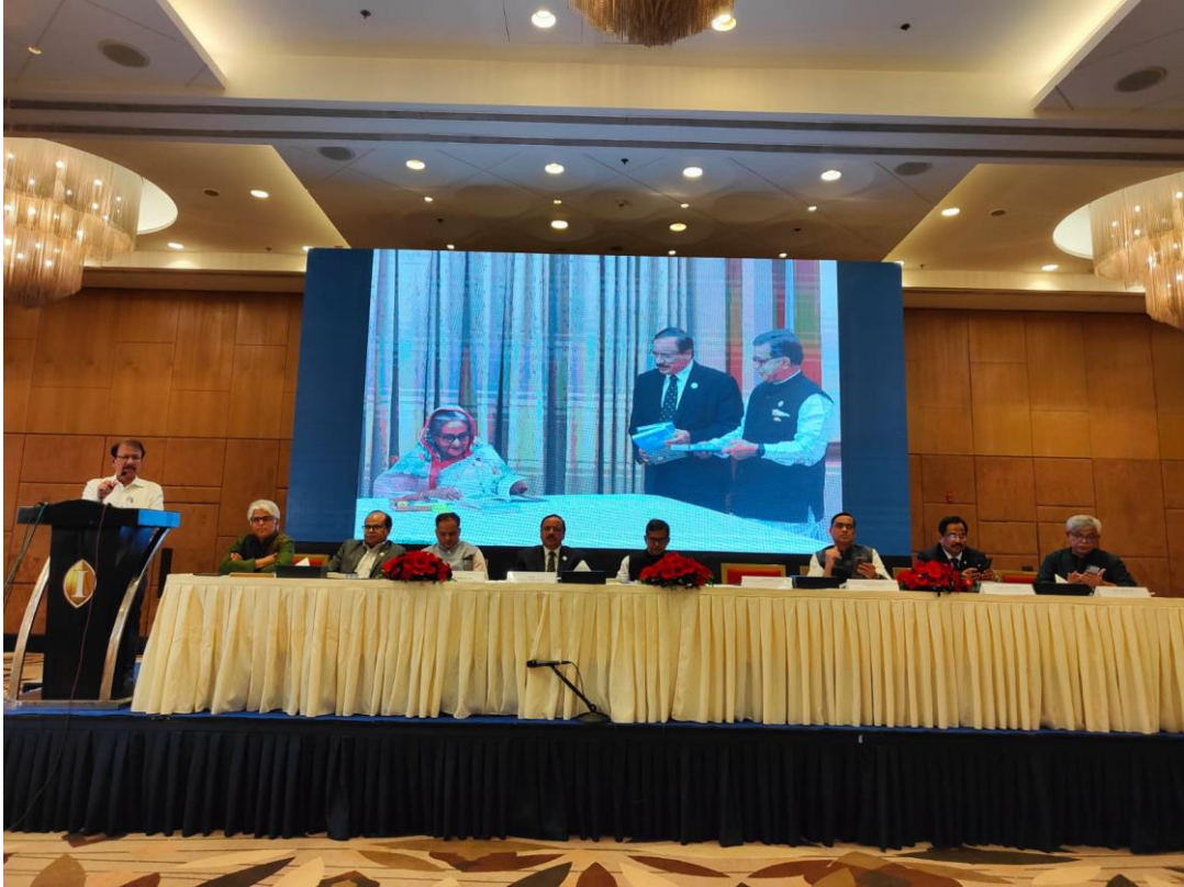
জাতীয় দিবস উপলক্ষ্যে 'মুজিবের বাংলাদেশ' স্মারকগ্রন্থের প্রকাশনা অনুষ্ঠান