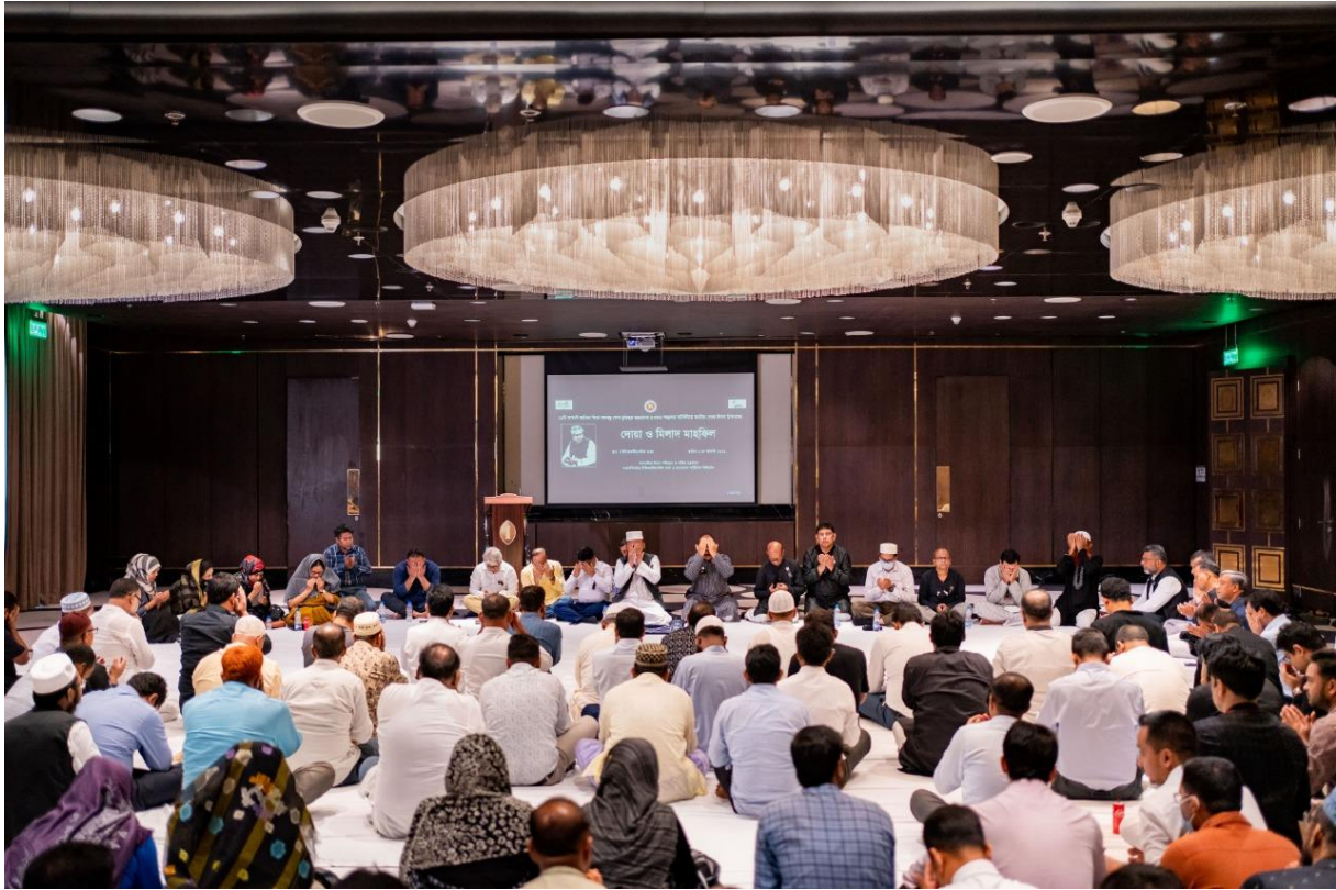
জাতীয় শোক দিবস উপলক্ষে ইন্টারকন্টিনেন্টাল ঢাকা হোটেলে দোয়া ও মিলাদ মাহফিল