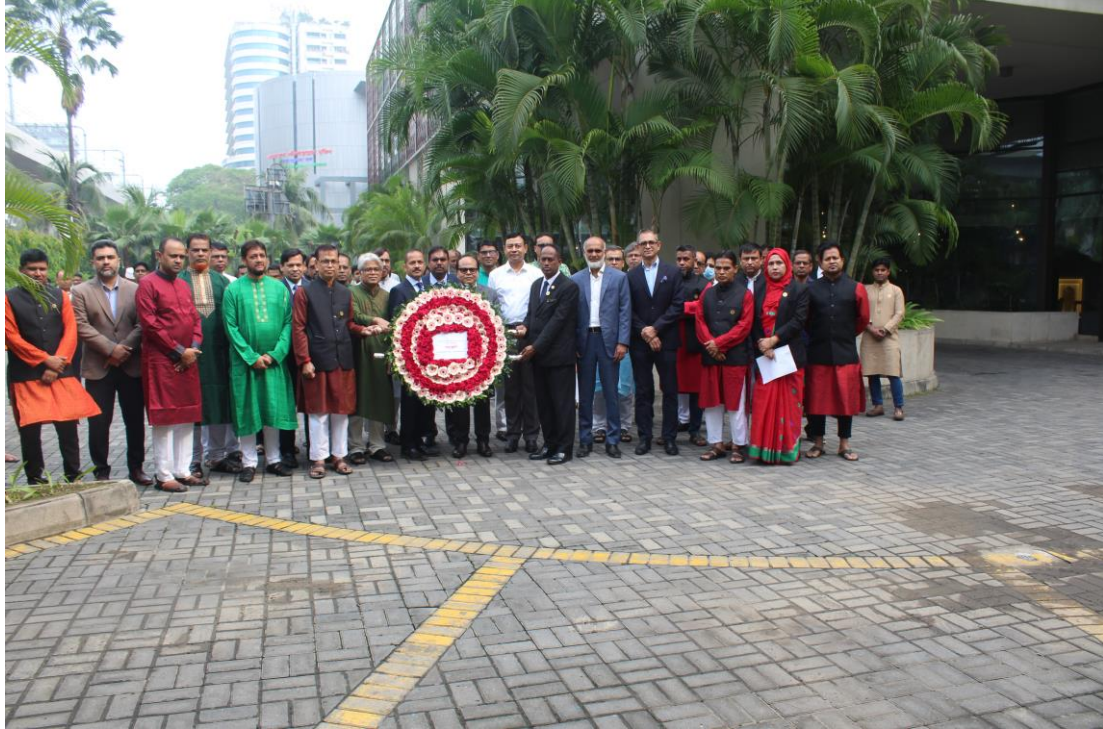
বিজয় দিবসের র্যালি