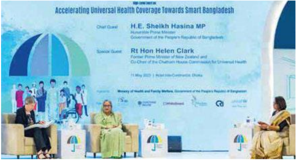
Accelerating Universal Health Coverage Towards Smart Bangladesh অনুষ্ঠানে মাননীয় প্রধানমন্ত্রী শেখ হাসিনা ও নিউজিল্যান্ড-এর প্রাক্তন মাননীয় প্রধানমন্ত্রী, রোটারিয়ান হেলেন ক্লার্ক-এর যোগদান