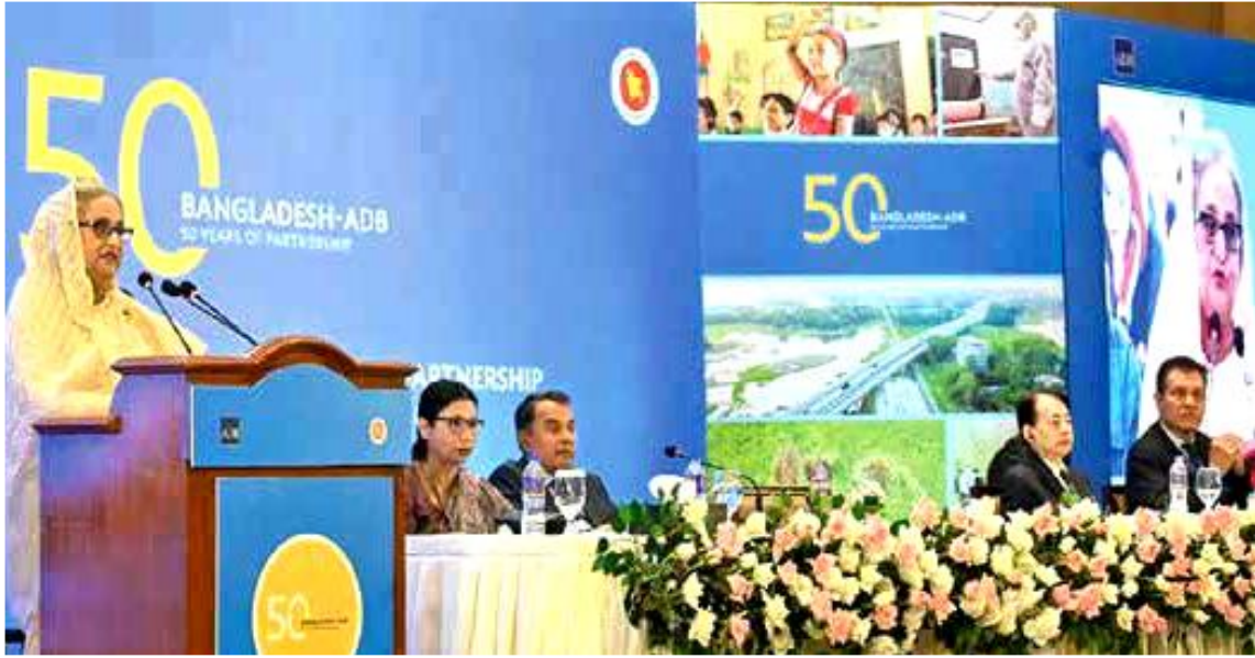
বাংলাদেশ-এডিবিৰ সম্পৰ্কেৰ ৫০ বছৰ পূৰ্তি