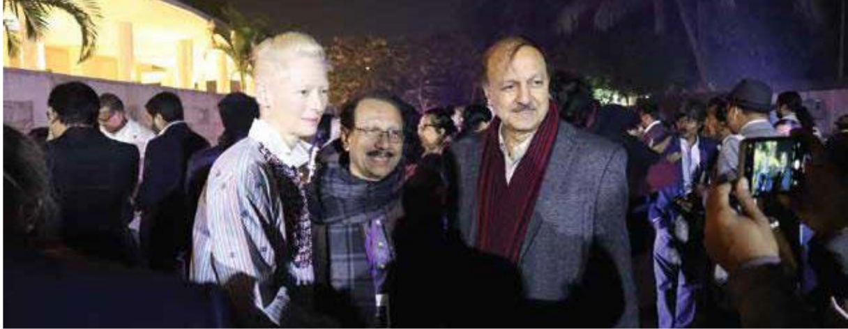
ঢাকা লিট ফেস্টিভল ২০২৩