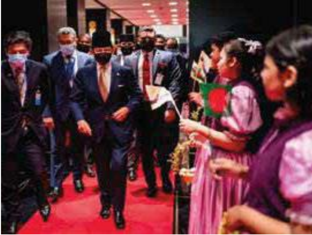
বাংলাদেশে ব্রুнай-এর মহামান্য প্রেসিডেন্ট হাসানআল বলখিয়ার সফরকালে ইন্টারকন্টিনেন্টাল ঢাকায় অবস্থান