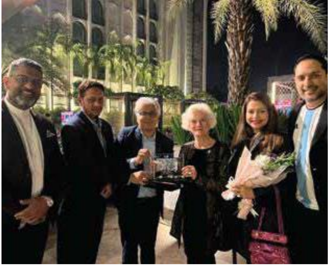
বাংলাদেশ সফরকালে ইন্টারকন্টিনেন্টাল ঢাকায় ফরাসি ফটোগ্রাফার-এ্যানি ডি হেনিং