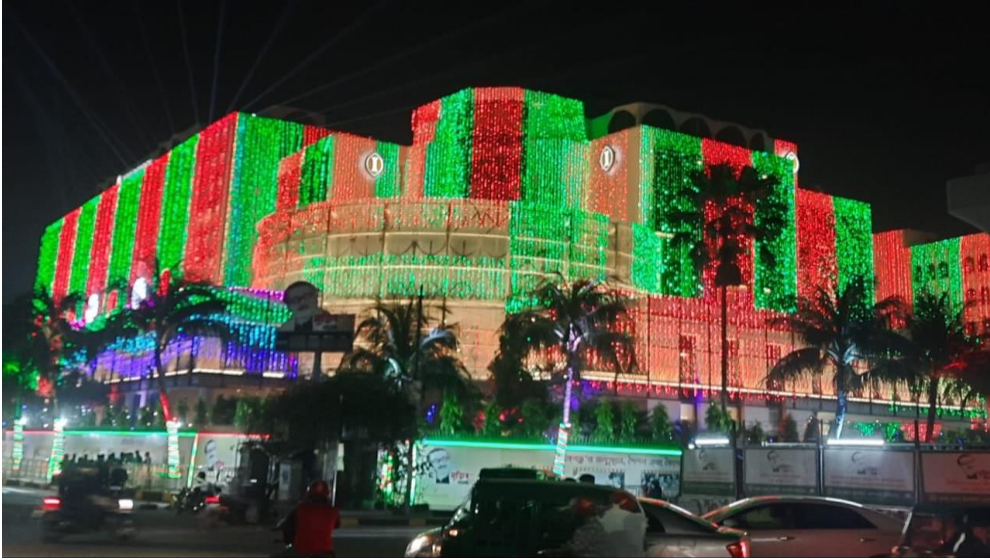
বিজয় দিবসে ইন্টারকন্টিনেন্টাল ঢাকা হোটেলে আলোকসজ্জা