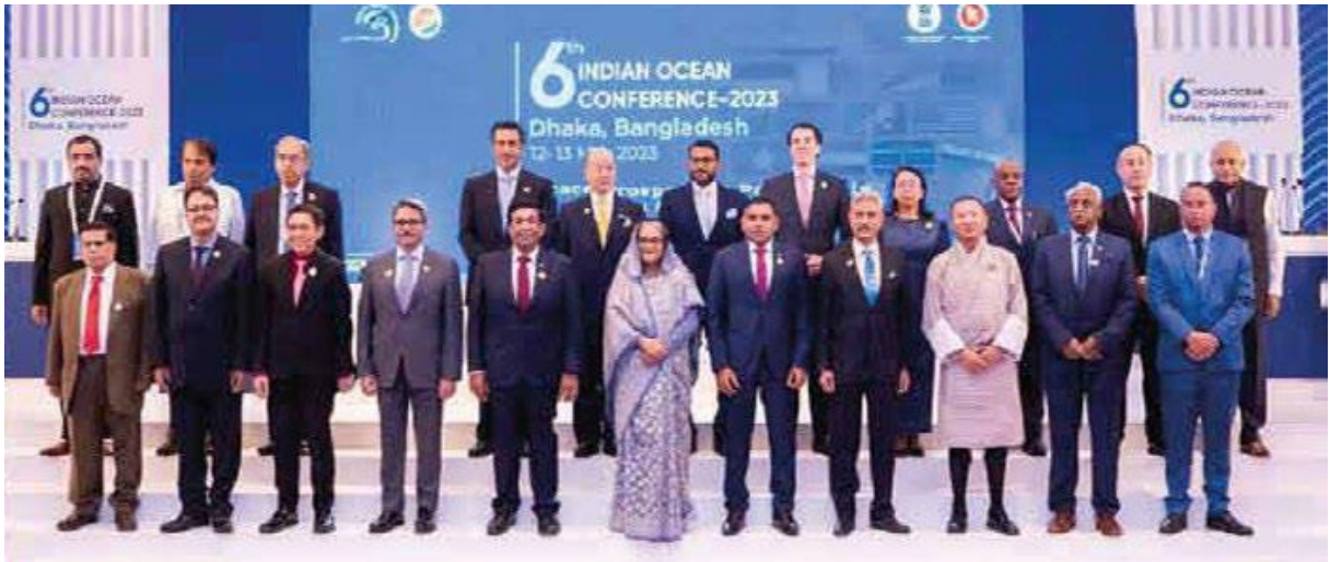
৬ষ্ঠ ভাৰত মহাসাগৰীয় কনফাৰেন্স-২০২৩