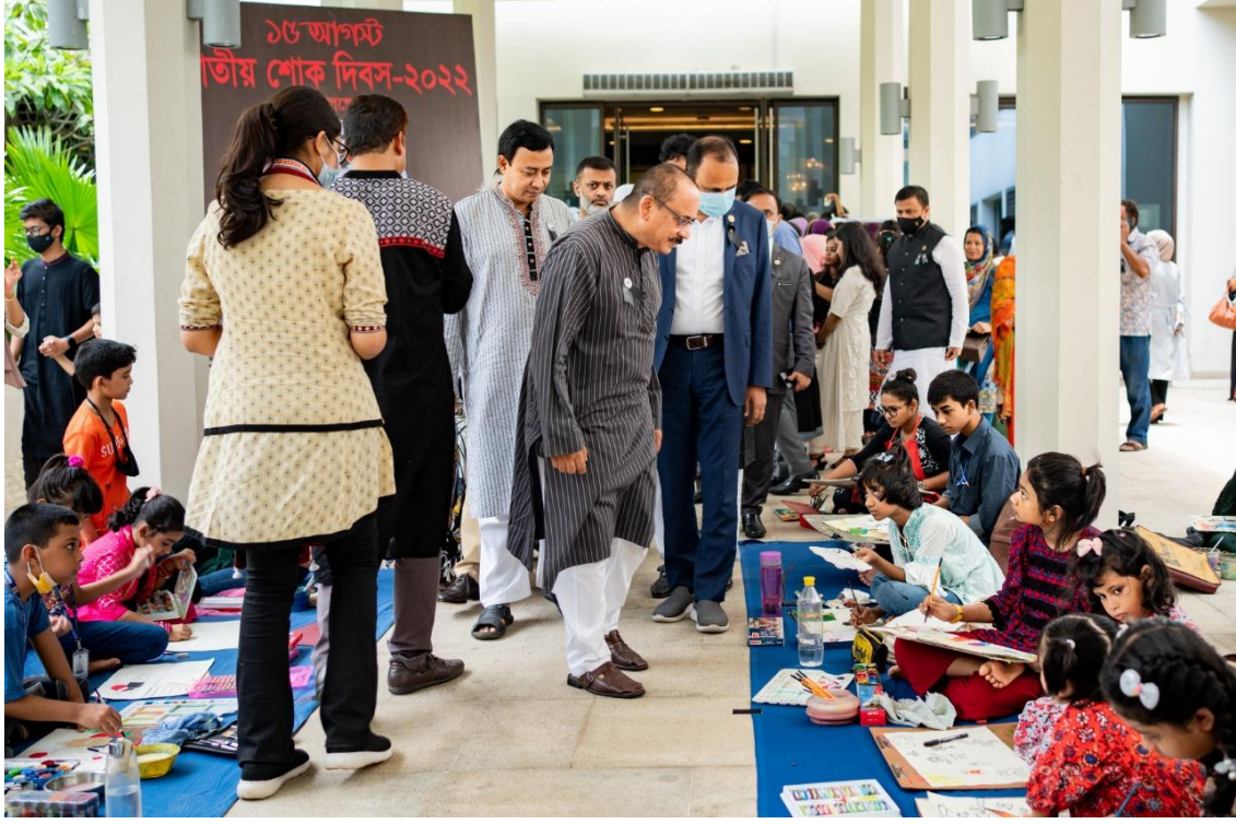
জাতীয় শোক দিবস উপলক্ষ্যে ইন্টারকন্টিনেন্টাল ঢাকা হোটেলে সংস্কৃতি বিষয়ক মন্ত্রণালয় কর্তৃক আয়োজিত শিশুদের চিত্রাঙ্কন প্রতিযোগিতা