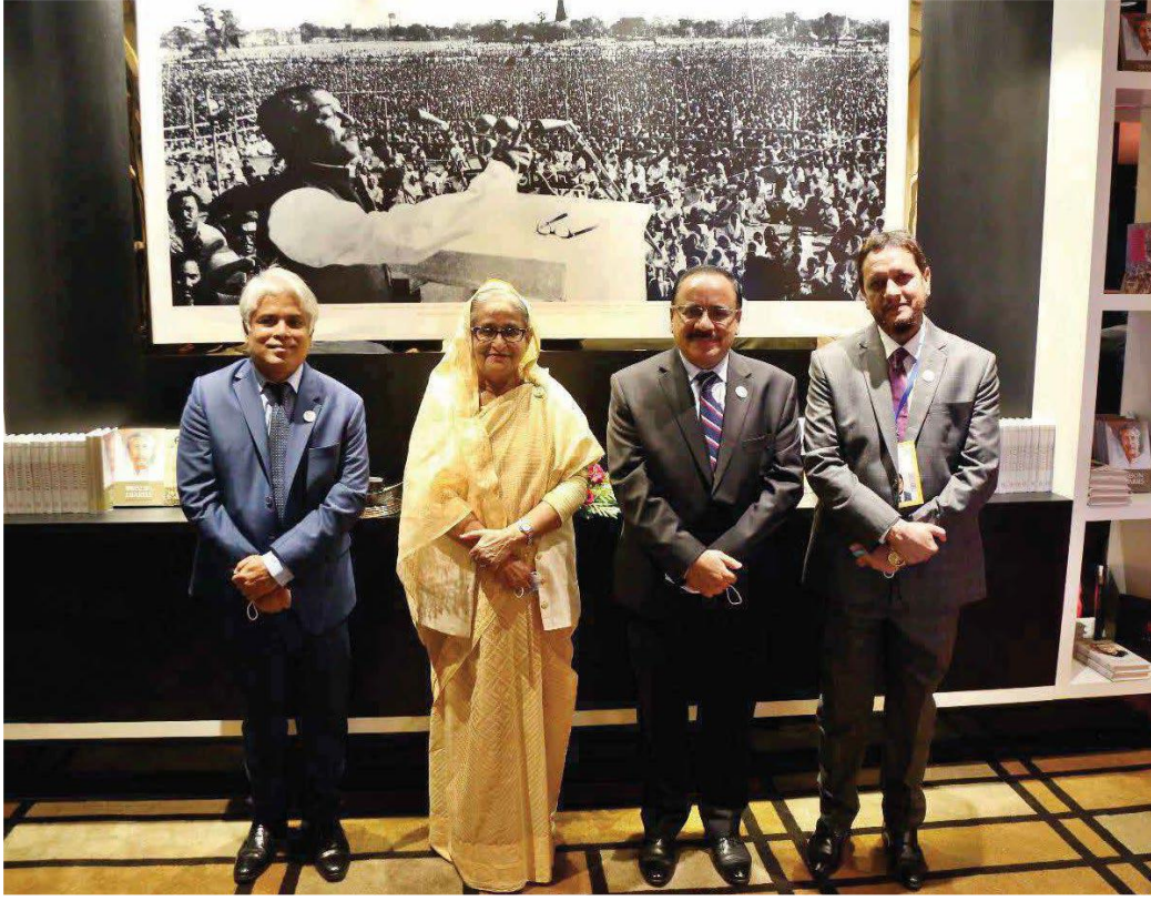
মুজিব কর্ণারে মাননীয় প্রধানমন্ত্রী