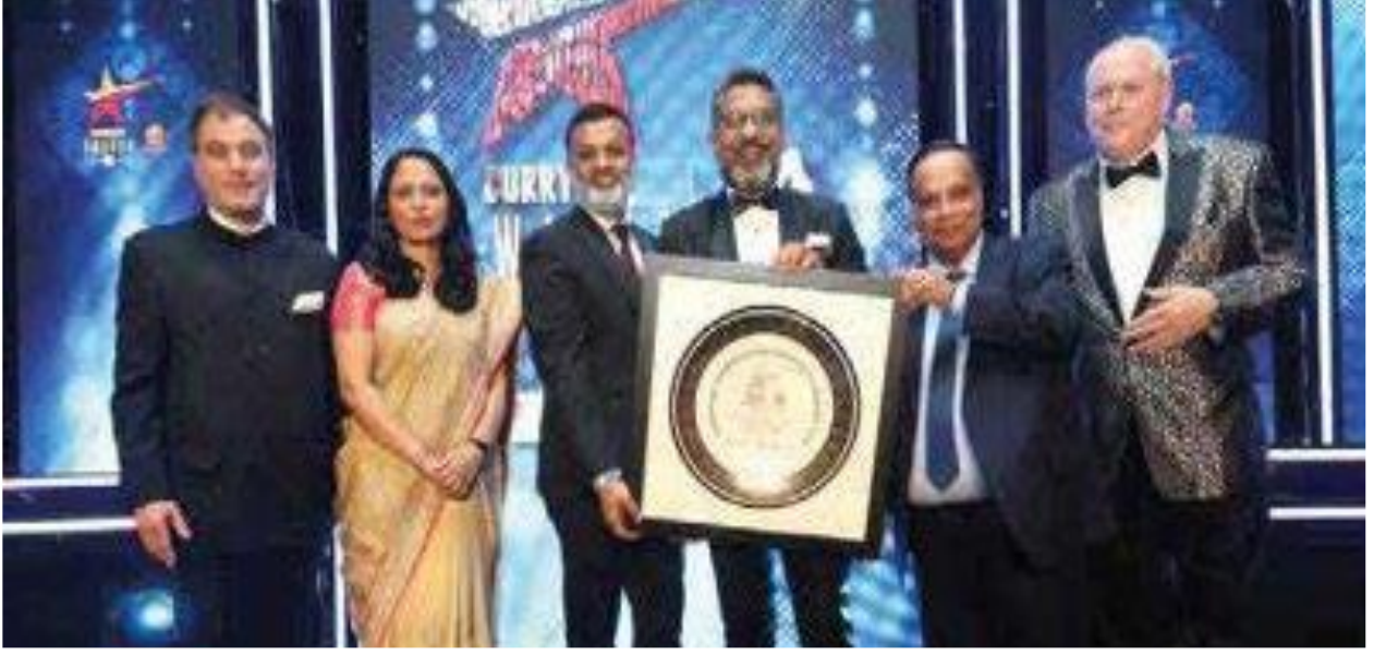
ইন্টারকন্টিনেন্টাল ঢাকার ব্রিটিশ কারি লাইফ পুরস্কার গ্রহণ