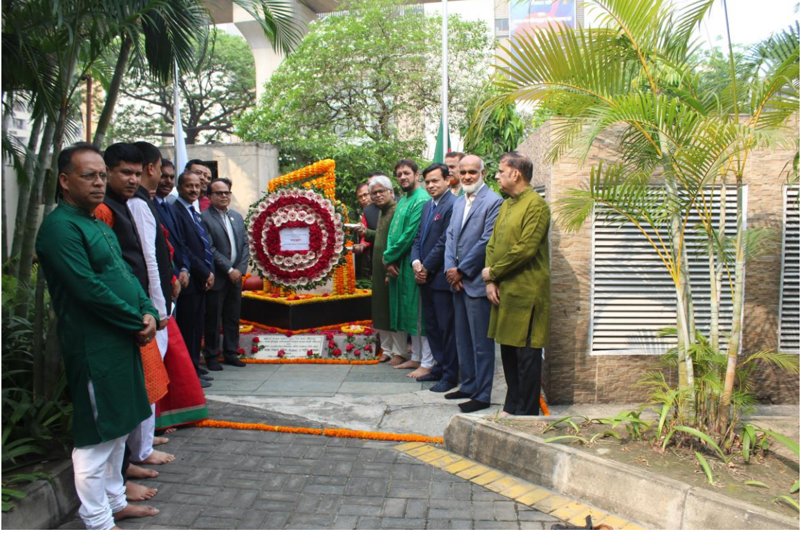
বিজয় দিবস উপলক্ষ্যে হোটেলের শহীদ মিনারে পুষ্পস্তবক অর্পণ