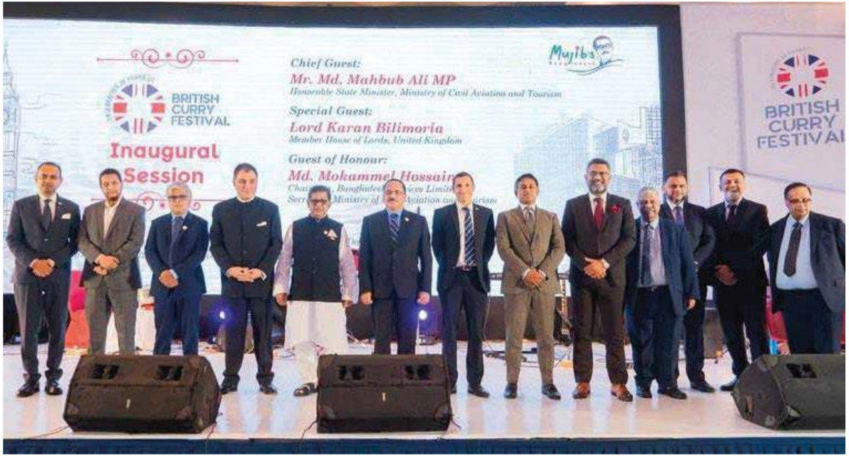
ব্রিটিশ কারি ফেস্টিভল-এর উদ্বোধনী অনুষ্ঠান